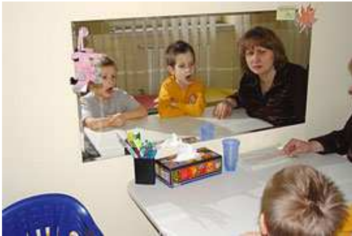
Unterricht mit einen Logopäden